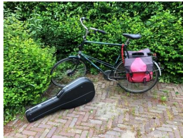
"Thuiswedstrijd" (kerkdienst) in Goes...op de fiets!