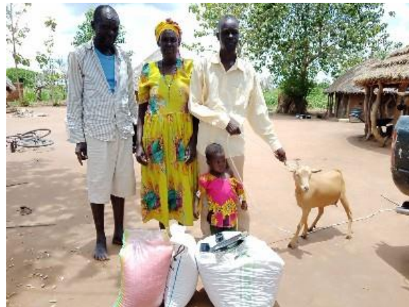
hulp in de villages, met zaigoed en geit

Vakantieplannen of wellicht gewoon thuis blijven...laten we mensen zijn die aandacht hebben voor de ander, voor de schepping om ons heen. Die een kaartje sturen, even een belletje doen. Om elkaar geven...dat willen we als stichting de Figurant ook blijven doen. En wat is het dan fantastisch om te zien hoeveel van jullie ons daarin steunen. Door geld te verzamelen, giften te geven, dozen opsturen, een marathon te lopen, dingen te organiseren, voor ons en Amecet bidden...het zijn maar een paar voorbeelden, maar het gaat gewoon maar door! Ook in de vakantietijd...Heel, heel hartelijk dank daarvoor, ook namens de stafmedewerkers van Amecet in Soroti.