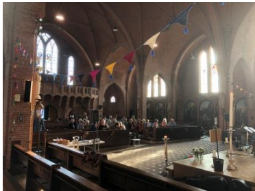
Kerkconcert in Koewacht