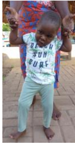
hulp bij de oefeningen...